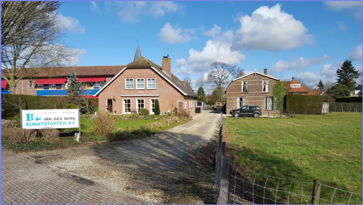
Boerderij Dubbelzand aan de Kon. Julianastraat 16, 2016.